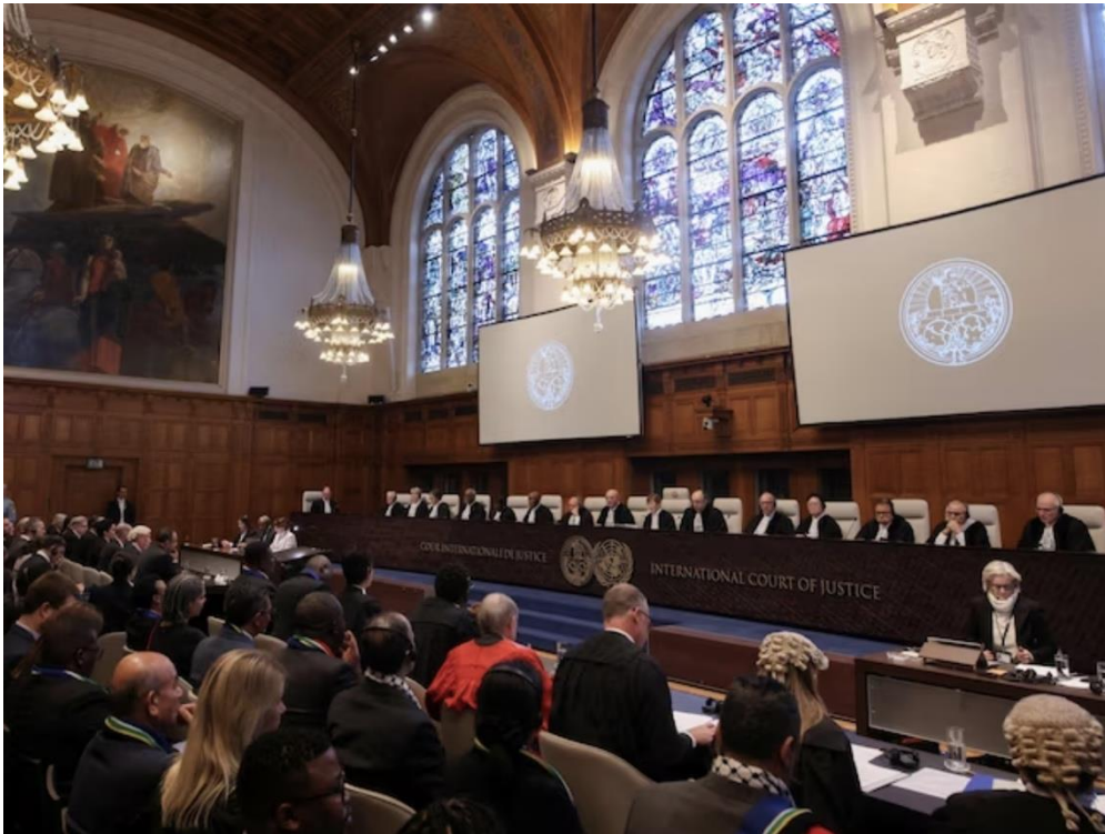
Image de la requête de l'Afrique du Sud devant la Cour internationale de justice (CIJ) des Nations unies contre l'État d'Israël, sur le « caractère génocidaire » de sa guerre contre les Palestiniens et Palestiniennes de Gaza. – 11 janvier 2024